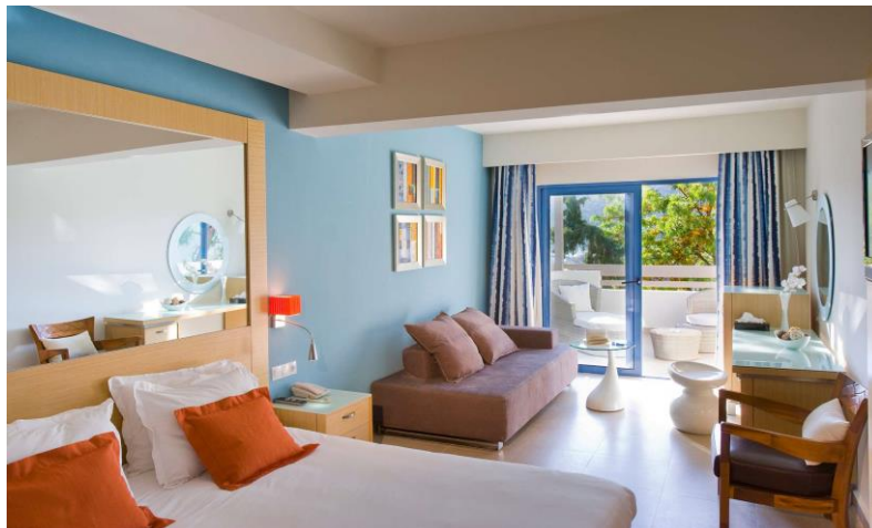
デラックスルーム